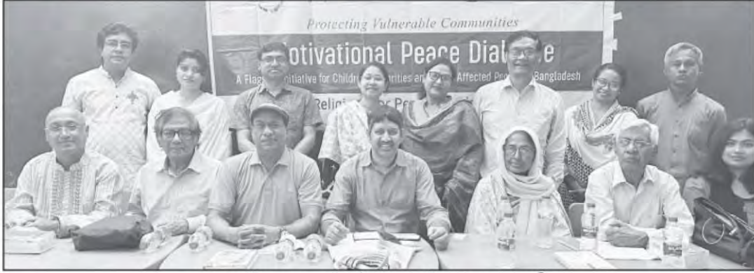
আরএফপি বাংলাদেশ চ্যাপ্টার আয়োজিত অংশগ্রহণকারীরা

১৬ মার্চ ২০২৫ | www.edainikazadi.net | ৬৫তম বর্ষ ১৮৯ সংখ্যা | ২ টার ১৪০১ সাল | ১৫ রমজান ১৪৪৬ হিজরি