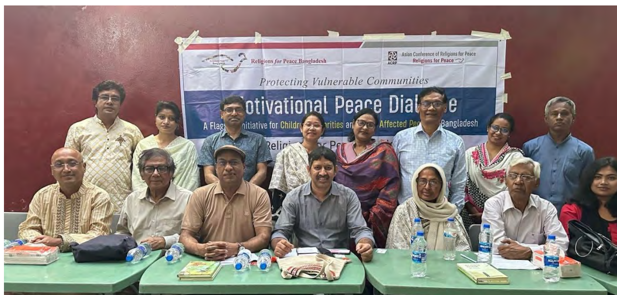
Participants at the "Faith Perspectives on Climate and Peace" dialogue organized by RFP Bangladesh Chapter.

The event, titled "Faith Perspectives on Climate and Peace," took place on Tuesday, March 11, 2025, at 'Gorba' Restaurant, MM Ali Road, Chattogram. It was organized as part of a flagship project under the Asian Conference of Religions for Peace (ACRP).