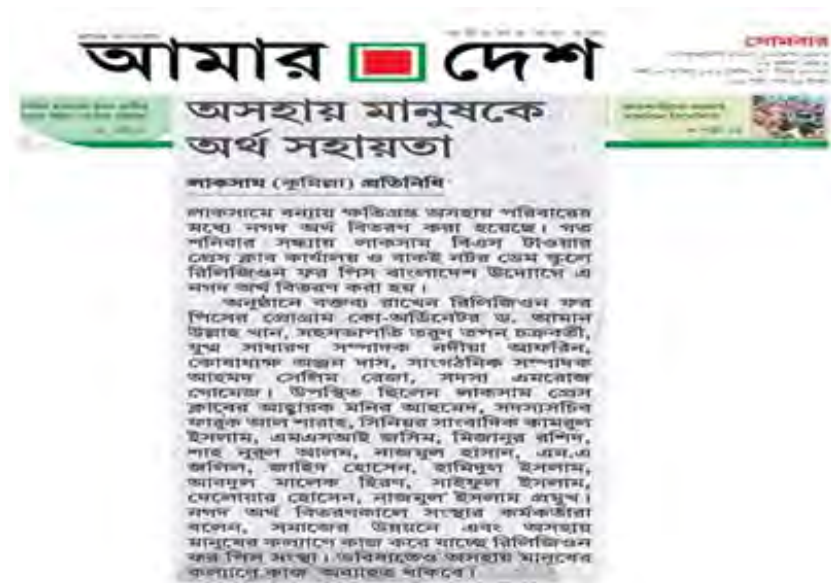
Amar Desh, a National Daily published the news of relief distribution of RfP Bangladesh