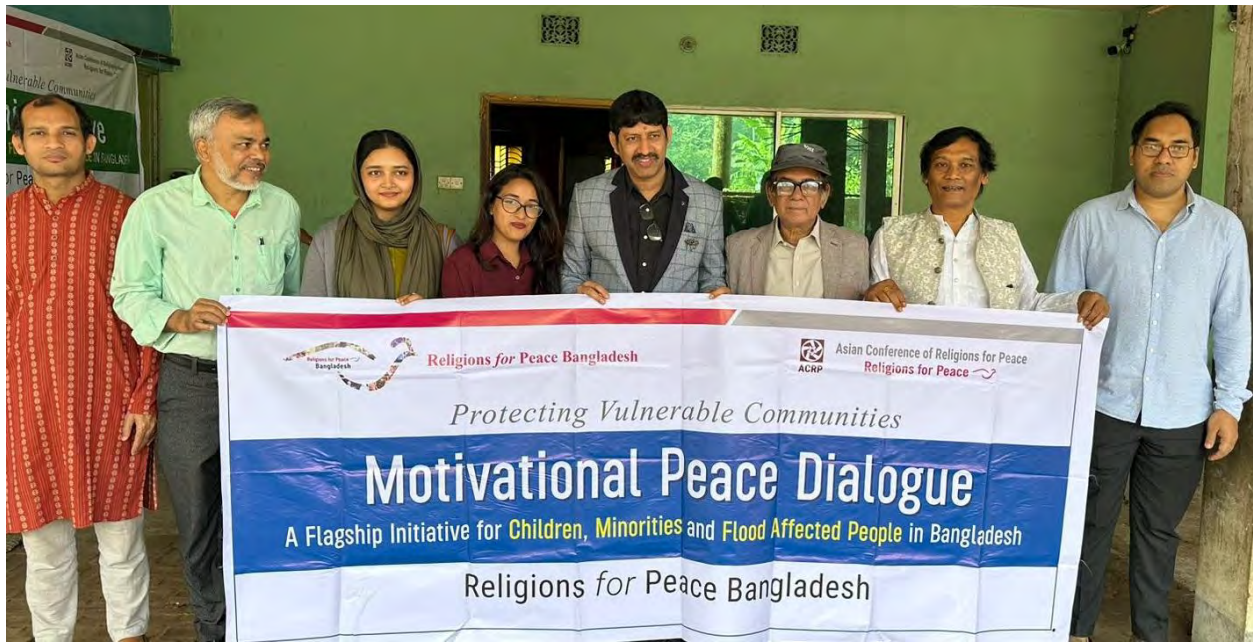
Discussion session at Birinchi, Feni, organized by ACRP and RfP Bangladesh Chapter.