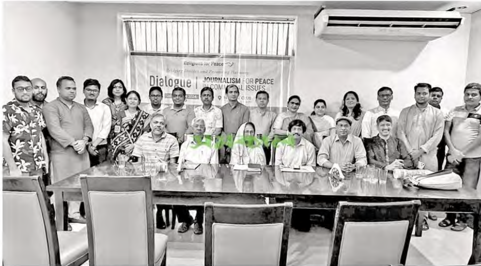
রিলিজিয়নস ফর পিসের সংলাপে অতিথিদের সঙ্গে অংশগ্রহণকারী চট্টগ্রামের বিভিন্ন মাধ্যমের সাংবাদিকরা

উল্লেখ্য, শান্তি প্রতিষ্ঠার প্রত্যয়ে ১৯৭০ সালে প্রতিষ্ঠিত আরএফপি সারা বিশ্বে একযোগে কাজ করছে। বর্তমানে প্রায় ১৪০টি দেশে আরএফপির সাংগঠনিক কর্মকাণ্ড অব্যাহত রয়েছে। বাংলাদেশেও সংগঠনটি পথ চলছে বহু বছর ধরে। বিশেষ করে ২০১৬ সাল থেকে বিস্তৃত পরিসরে আরএফপির কর্মতৎপরতা চলছে।