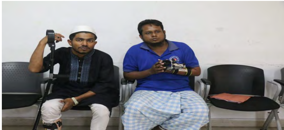
July August Victim