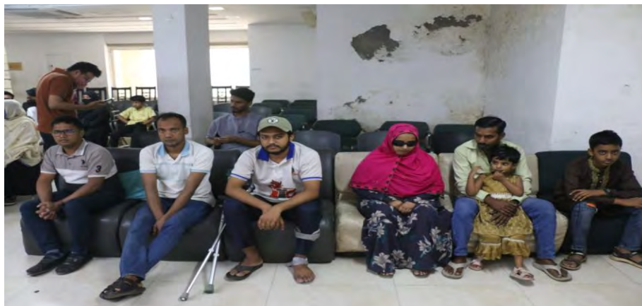
July-August 2024 Victim