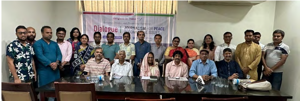
Participants of the dialogue "Journalism for Peace in Communal Issues"

He raised concerns about the state of independent journalism, suggesting that we do not have a completely free environment for reporting news. However, he emphasized that the truth will always come out, whether it involves religious or political matters.