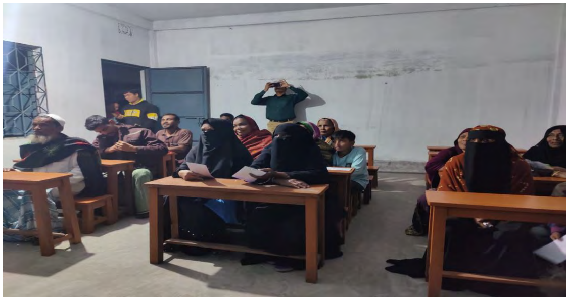
Relief recipient from the Noakhali district