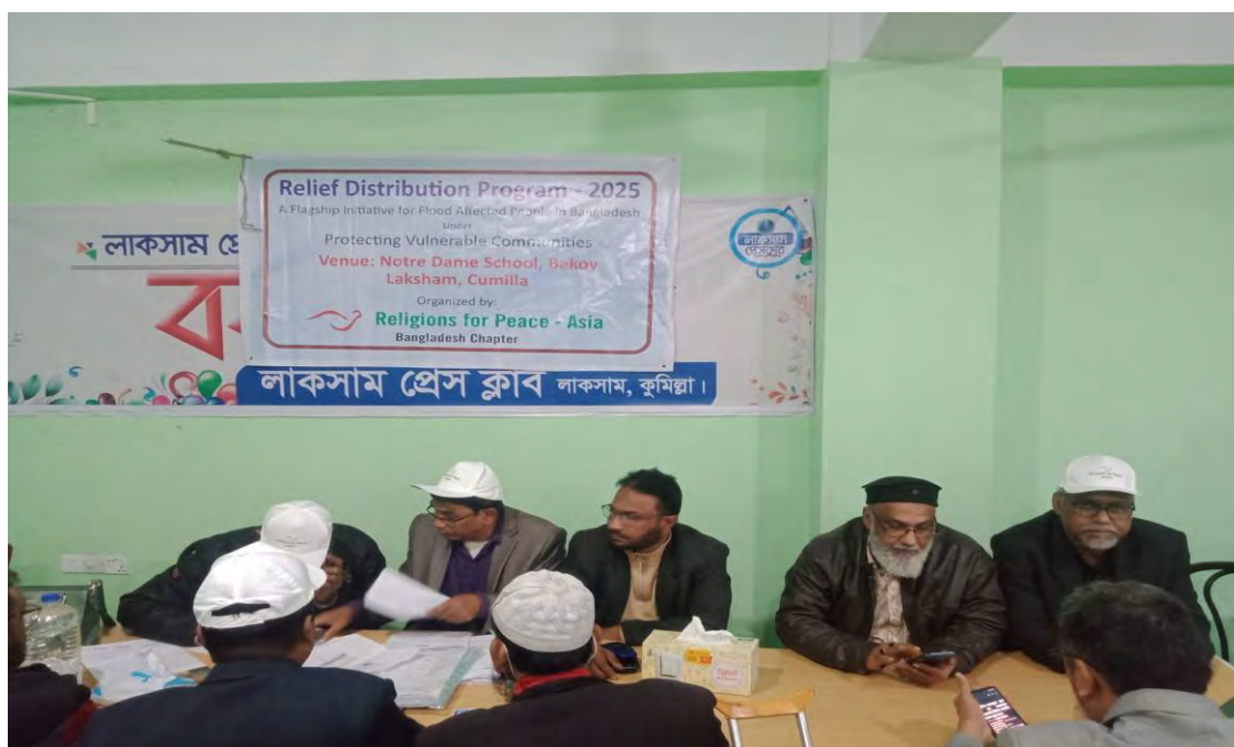
Relief distribution on Laksham, Comilla

The relief distribution committee also visited Laksham Comilla and Feni to distribute the relief among the flood-affected people (See Images).