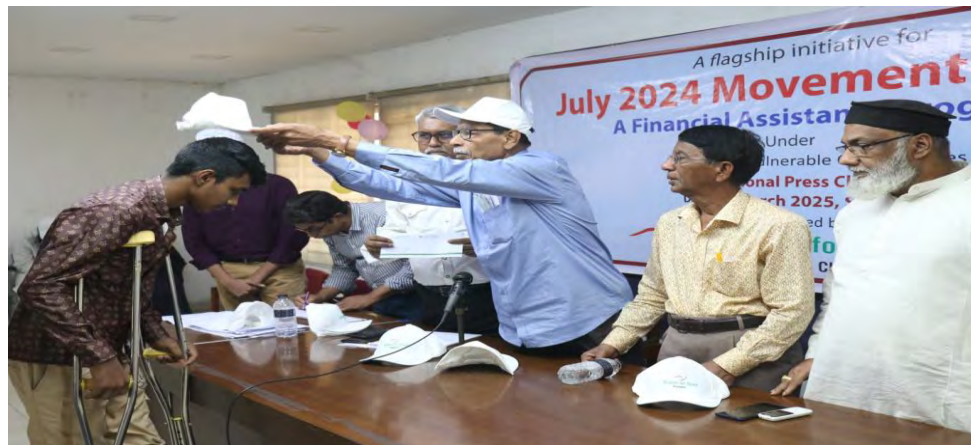
Donation given to a victim

The Religion for Peace, Dhaka wing distributed financial assistance to 50 injured students and young people.