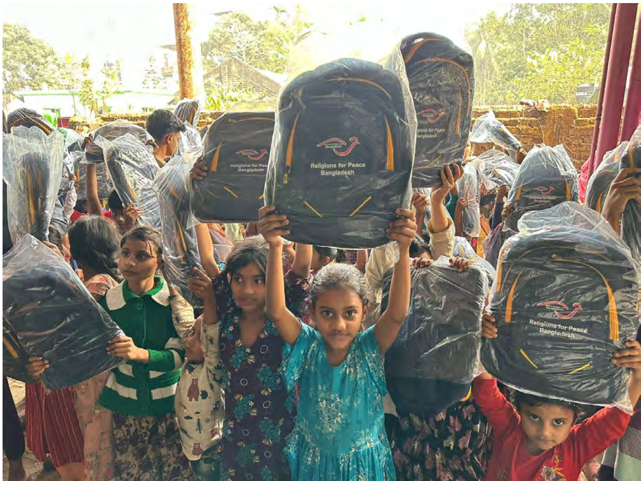
School supply distribution and children's excitement at Birinchi, Feni