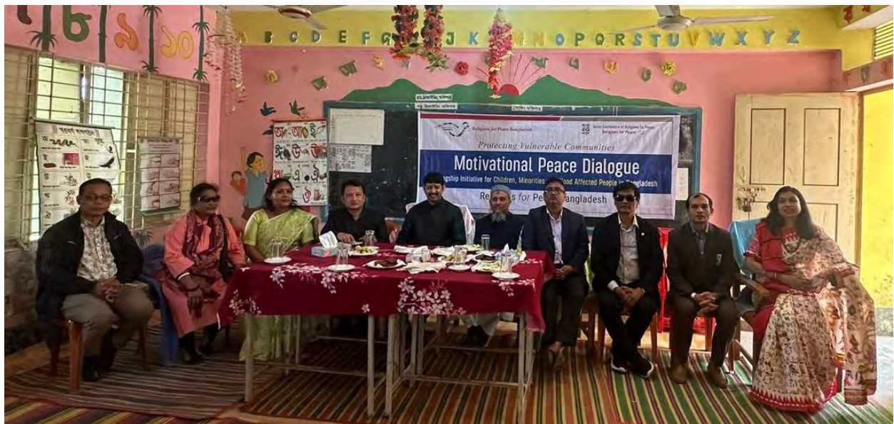
Discussion session at Choungrachhari, Mahalachhari, Khagrachari, organized by ACRP and RfP Bangladesh Chapter