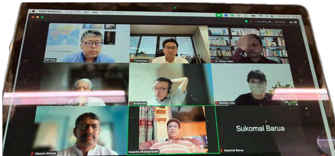
Meeting with ACRP regarding Flagship Project

1. Introduction This report presents an overview of the Flagship Project initiated by the Religions for Peace (RfP) Bangladesh Chapter in collaboration with the Asian Conference of Religions for Peace (ACRP). The project aims to support vulnerable communities, particularly schoolchildren affected by floods, victims of July-August 2024 political unrest, ethnic minorities facing discrimination, and communities requiring immediate relief and rehabilitation.