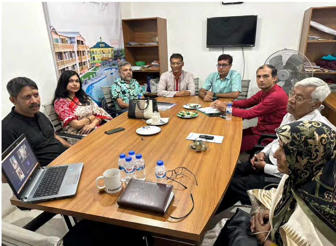
The Executive Committee of RFP Bangladesh held on convened on 17 October, 2024

The Executive Committee of Religions for Peace Bangladesh convened on two significant occasions—October 17, 2024, and January 11, 2025—to discuss and implement key initiatives, particularly the Flagship Project. These meetings, presided over by senior leadership, underscored RfP Bangladesh's commitment to supporting vulnerable communities affected by natural disasters and socio-political unrest.