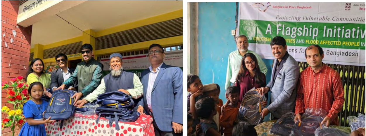
School supply distribution and children's excitement at Choungrachhari, Mahalachhari, Khagrachari, and Birinchi, Feni