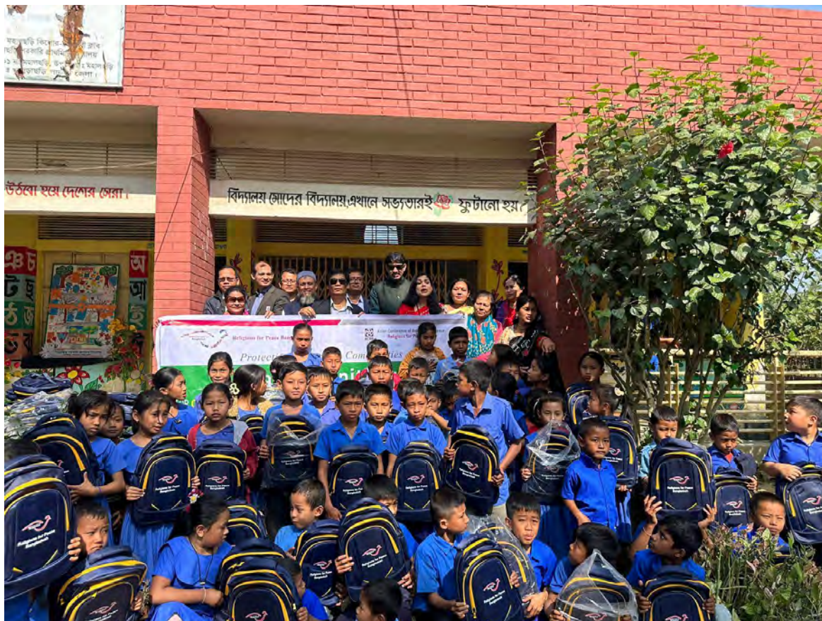
School supply distribution and children's excitement at Choungnachhari, Mahalachhari, Khagrachari, organized by ACRP and RfP Bangladesh Chapter.